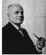
Jacob Viner (1892-1970)