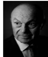
Eugene Fama (1939-)