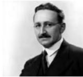
Friedrich Hayek (1899-1992)