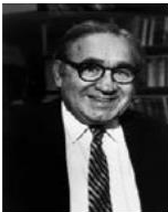
Robert Fogel (1926-2013)