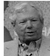
Richard Thaler (1945-)