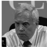
James Heckman (1944-)