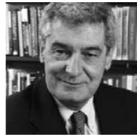
Robert Lucas (1937-)