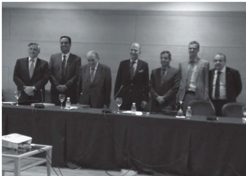
El nuevo doctor (tercero por la derecha) con el tribunal y su director de tesis.