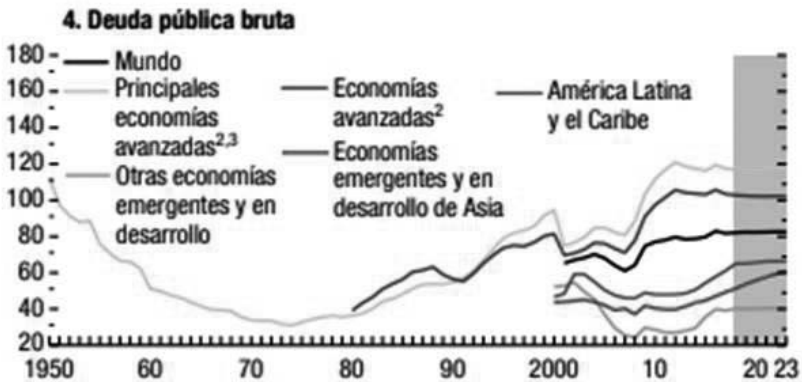
CUADRO N.º 1 DEUDA PÚBLICA BRUTA